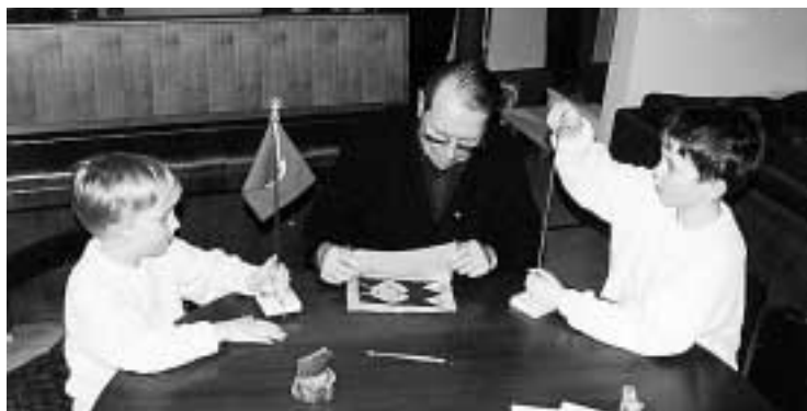
Mauri kokeilee viirin käärimistä suojaavaan silkipaperiin. Toistaiseksi viirit jäävät vielä kodin koristukseksi hyllylle.