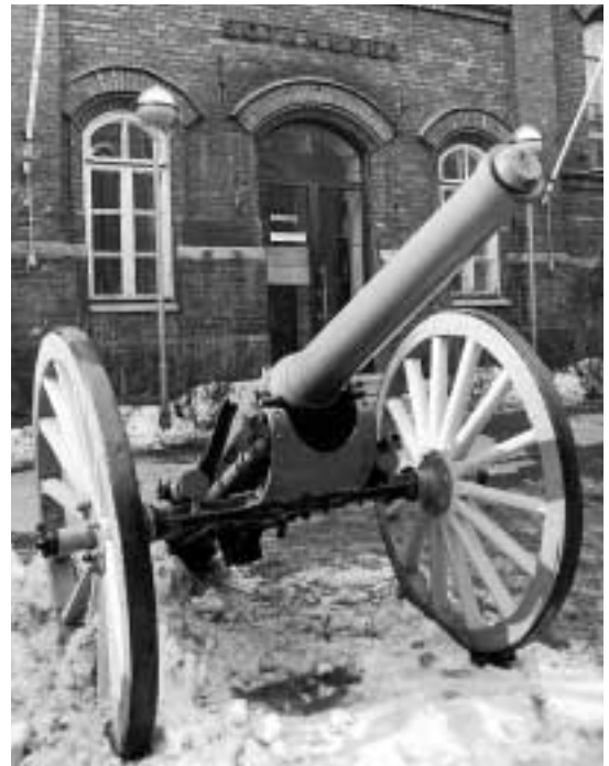
Sotamuseon laajentaminen Helsingin Kruununhaassa on tärkeä ja ajankohtainen perinnehanke.

Kunakin näistä merkkipäivistä julkisen vallan ja Puolustusvoimien sekä etenkin veteraani- ja maanpuolustusjärjestöjen edustajat ja kaatuneiden omaiset käyvät kunniakäynneillä sankarihaudoilla ja -muistomerkeillä.