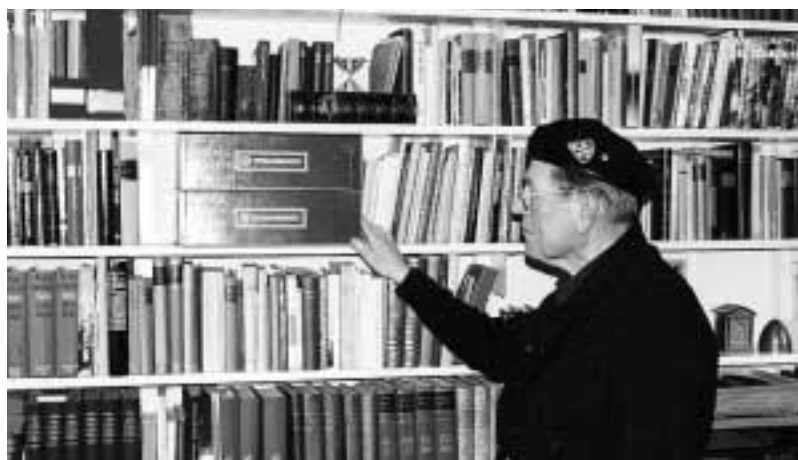
Veteraanikansiot ovat löytäneet paikkansa kirjahyllystä perheraamatun ja vanhojen kirjojen vierestä. Siinä ne eivät unohdu kätköönsä, vaan ovat nuorempien sukupolvien käytettävissä, kun halutaan palata muistelemaan veteraanin elämänvaiheita.