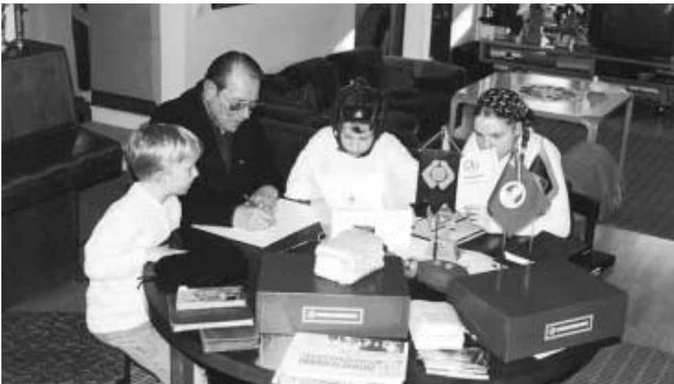
Veteraanikansioon kuuluvan Perinneasiakirjan sisältöluettelon laadinta menossa. Pöydällä odottavat vuoroaan mm. kirjeniput, laulukirja vuodelta 1942, valokuvia nipussa ja albumissa sekä nykyajasta kertomassa liiton lehti Sotaveteraani .