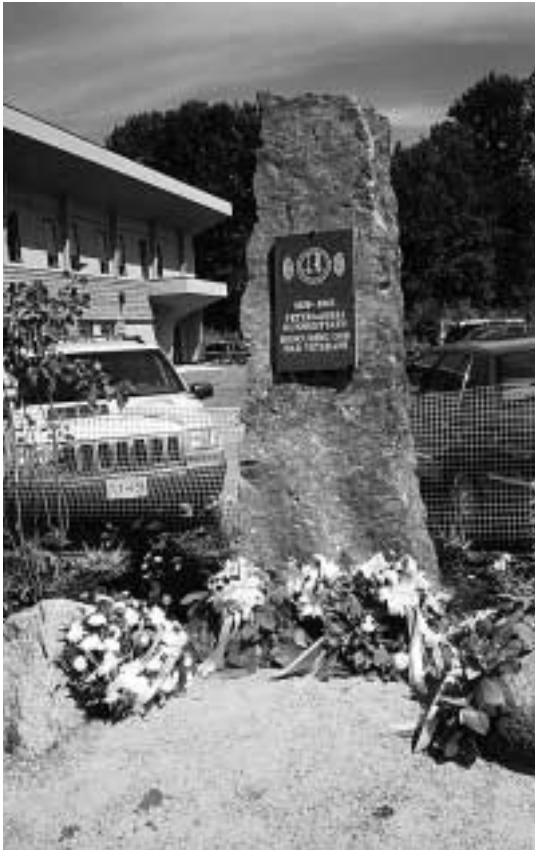
Veteraaniveljeys ja yhteisten perinteiden vaaliminen yltyivät yli rajojen. Barnabyssa, Kanadan Brittiläisessä Kolumbiassa paljastettiin kesällä 1999 suomalaisveteraanien muistokivi ja pidettiin sotaveteraaniparaati.

naisten liiton yhteistoimintaelin, sekä Kaatuneitten Omaisten Liitto antoivat syksyllä 1999, jolloin oli kulunut 60 vuotta syksyn 1939 YH:sta ja talvisodan alkamisesta, Suomen nuorisolle ja sen kasvattajille osoitetun julkilausuman, joka julkaistiin muun muassa Opetushallituksen Spektri-lehdessä ja Opettaja-lehdessä sekä veteraanilehdissä. Julkilausumassa todettiin viime sotiemme tausta, kulku ja lopputulos – itsenäisyyden säilyminen – sekä kansalaisten veteraaneille osoittama kiitollisuus. Veteraanien ja sankarivainajien omaisten sanoma päättyy seuraavasti: ”Toivomme, että arvostatte niitä kestäviä elämän arvoja, joita me sodissa puolustimme. Selviydymme koettelemuksista puolustustahdon, yhteenkuuluvuuden, velvollisuudentunnon ja elä-