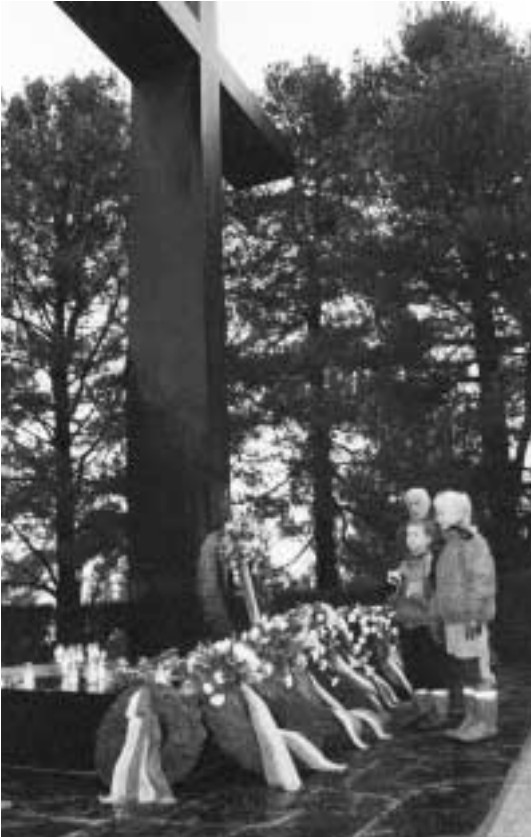
Helsingin Hietaniemen sankarihautausmaan suurrusti on kansallinen muistomerkki

Vuosittain kuolee noin 12 000 sotiamme veteraania. Veteraanin siunaustilaisuus on tavallaan myös perinnetapahtuma: se voi muistuttaa siitä, että vainaja oli itsenäisyysotiemme veteraani, joiden elämäntyö ansaitsee kunnioitusta.