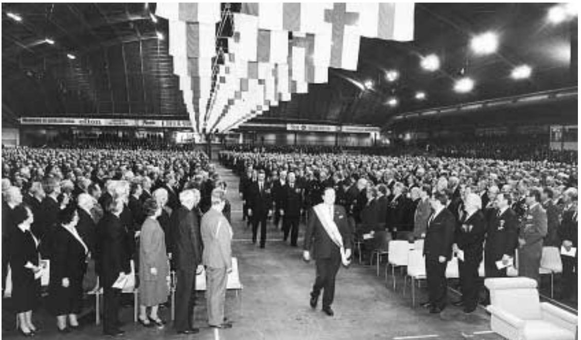
Ensimmäisen kansallisen veteraanipäivän valtakunnalliset juhlallisuudet olivat Lahdessa. Tasavallan presidentti Mauno Koivisto, kunniaveteraani, saapuu pääjuhlaan.