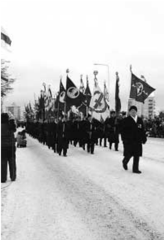
Veteraaniyhteisöjen lippulinjat välittävät perinnetietoa tiuhaan ja yli rajojenkin.

Perinnetyötä tehdään monissa muissakin yhteisöissä ja säätiöissä, etenkin niissä, jotka ovat tarkoitusperissään määrittäneet sen tehtäväkseen, mutta myös niissä, jotka muutoin katsovat voi-